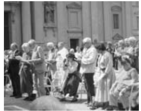
Zuschauer singen die Bayernhymne

Das Bläser-Ensemble der Blinden Musiker lenkte nun die Aufmerksamkeit der Zuhörer auf eine Komposition von Johann H. Schein aus dem 16. Jahrhundert. Das Publikum verfolgte die Darbietung mit großem Interesse, war es doch erstaunlich, mit welcher Präzision diese Gruppe trotz ihres Handicaps gemeinsam zu musizieren verstanden: großer Beifall.