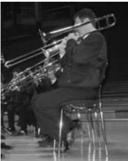
Blasorchester St. Michael München-Perlach