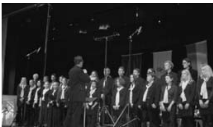
Chor der Berufsfachschule für Musik Kronach