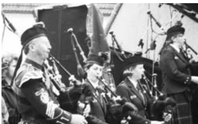
Huntly and District Pipeband, Schottland