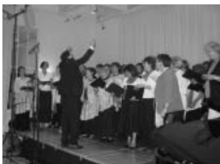
Ensemble Vocal Allegro und Chorale franco-allemande de Munich