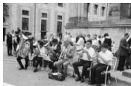
Bläser-Ensemble Blinde Musiker München