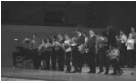
Abschluss-Finale im Gasteig