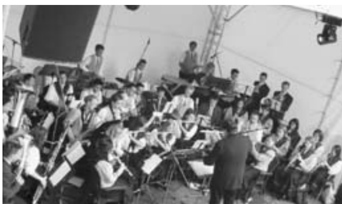
Schüler- und Jugendorchester Küps