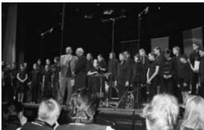
Jugendchor Aloeëtte aus Oudenaarde, Belgien