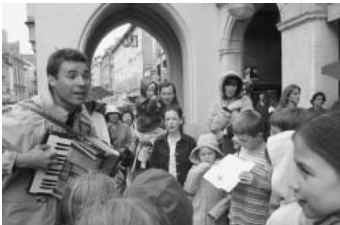
ETM Sing- und Musikschulveranstaltung München 4. 7. 2003