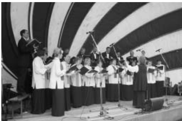
ETM-Großveranstaltung Kronach 4. – 6. 7. 2003