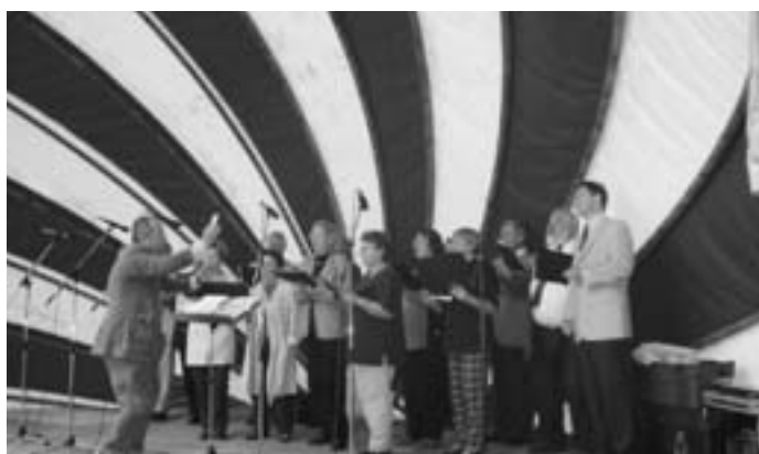
Evangelischer Dekanatschor Kronach