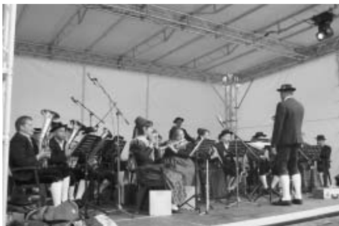
ETM-Großveranstaltung Kronach 4. – 6. 7. 2003