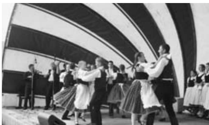
Tanzgruppe Halas und Fabatka, Kiskunhalas, Ungarn