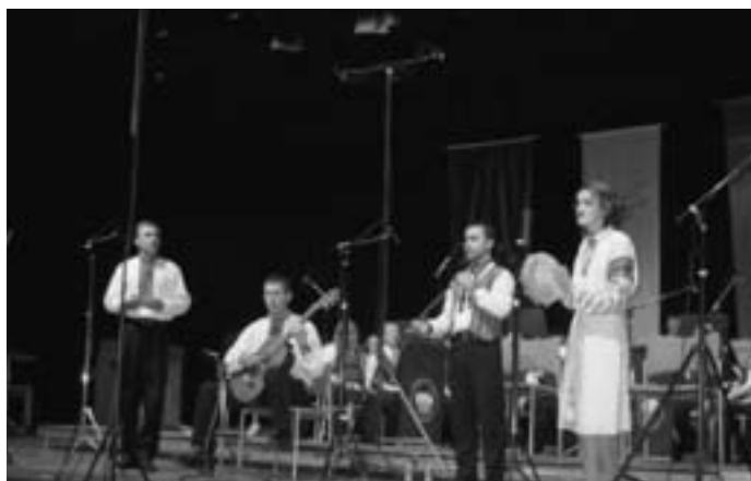
Ensemble Original, Ukraine