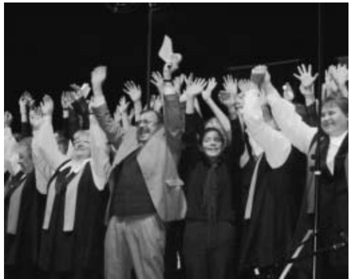
Finale in Kronach

Wiederholung von ETM-Kronach: Di. 5.8.2003, 18.30 bis 19 Uhr Bayern 2 Radio „Nahaufnahme“