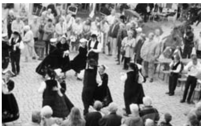
Tud-Mad, Hennebont, Frankreich