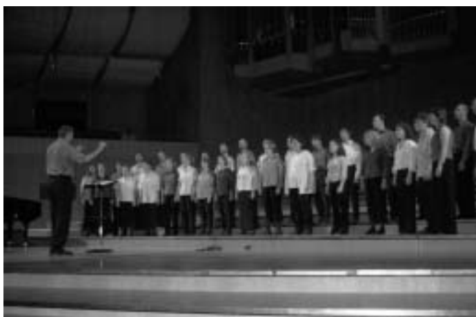
München Gasteig 6. 7. 2003