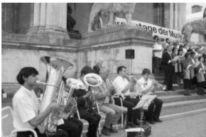
ETM-Abschluss München 6. 7. 2003